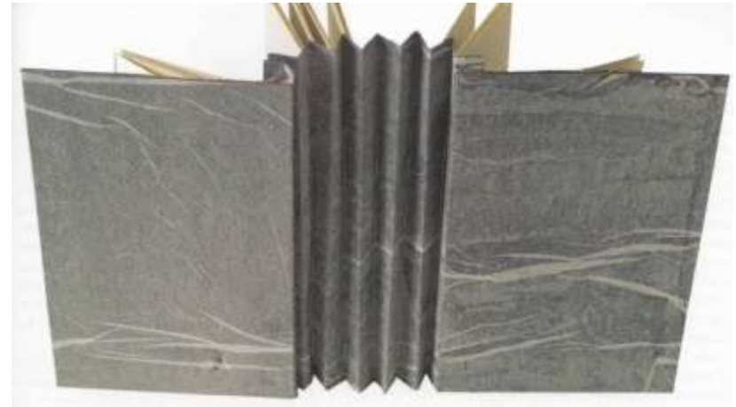
Reliure Myriam Basset