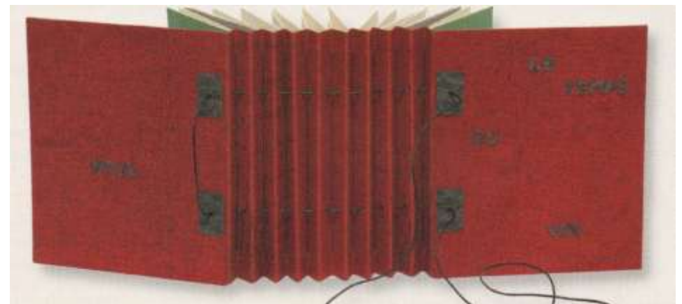
Reliure Anne-Lise Chapperon