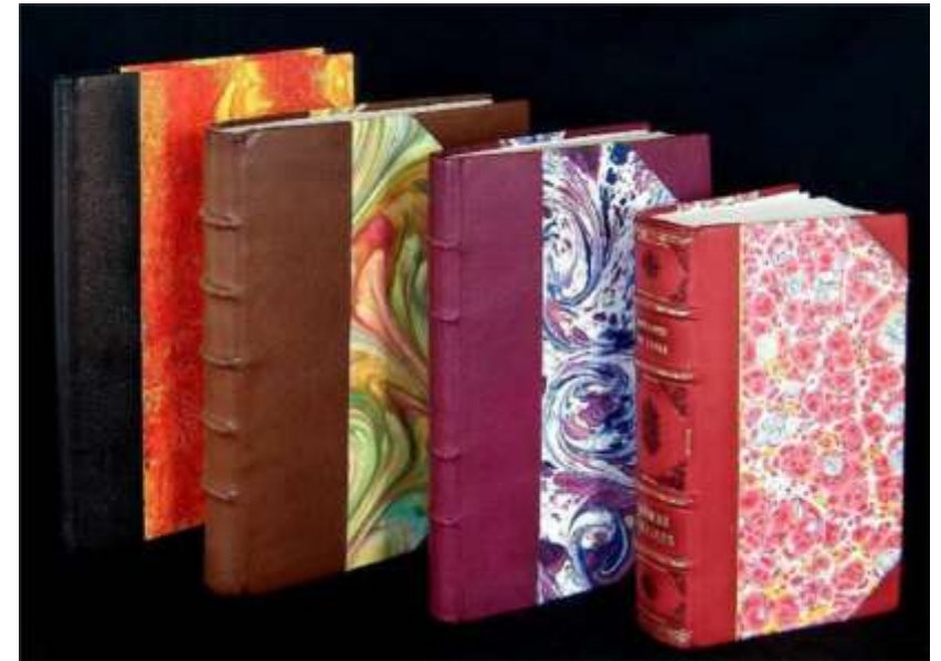
Reliures de Claire Gonzales