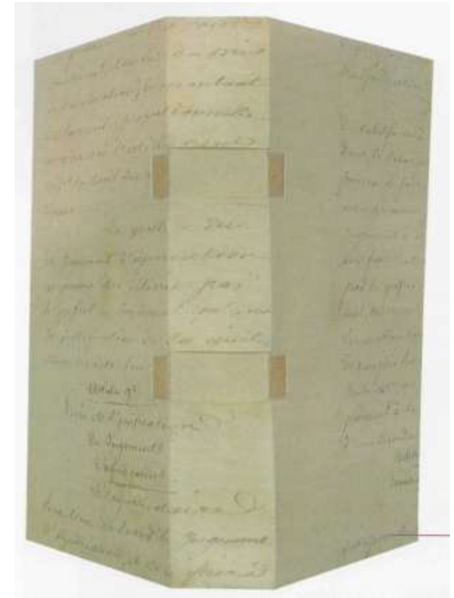
Reliure de Godelieve Dupin de Saint Cyr